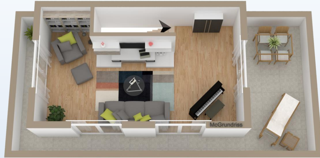
Dachgeschoss / Studio